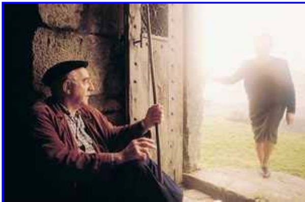
Santa Engraziko ermita.

Argia hiru leiho txikitatik sartzen da ermita barruan. Ate dobelatuak urbedeinkatu-ontzi izugarri bat du ondoan, oso