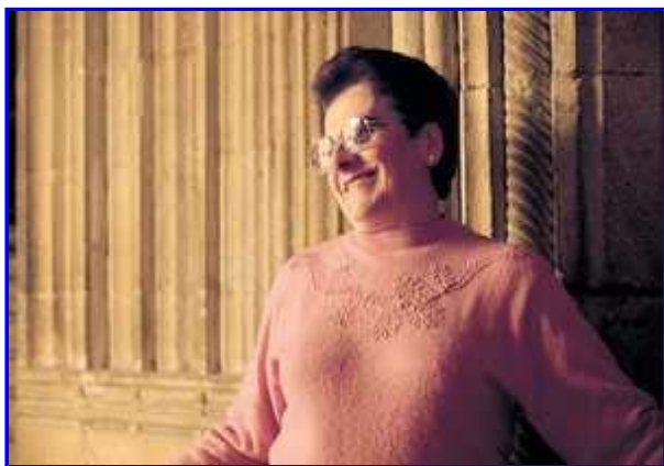
Jasokundeko Andre Mariaren elizako elizpean.

Aizarnak bere hiribildu joeran porrot egin zuen, zelai irekiak herri itxiak baino nahiago izan zituelako. Herriaren erdialdean, diotenez Templarioen antzinako eliza zen Jasokundeko Andre Mariaren parrokiaren elizpe gotiko ederrak, bere estiloaren edertasunean dagoeneko iragan diren oparotasun garaiak gogorarazten dizkigu. Bere lineak Azkoitiko parrokiako portadetariko bat gogorarazten dute berehala. Bere forma guztiek gure begirada Santa Mariaren harrizko tailara bidera dadin eragiten dute, bere oinazpikotik Zestoa eta Aizarnazabalgo bide zakarrak jarraitzen zituzten ibiltariak bertara iristen ikusten zituen irudia.