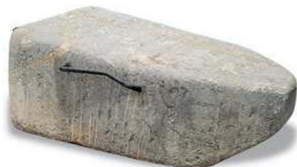
Idi-demarako harria Aizarnako plazan.

Santa Engrazi bakarti dago Ernioko mazizoko gutxien bisitatutako areetariko baten erdian. Santa Engrazik ahalik eta gehien eutsi dio denborari. Eutsi dio eta eutsi egiten dio, bere hormek metro t' erdi inguruko lodiera baitute. Bere kanpai-horma Gipuzkoako bikainenetariko bat da, Segurako Santa Engrazi ermitako kanpai-hormarekin soilik gonbara daitekeena. Harri horiek eusten duten kanpai erraldoiak inork deszifratu ez duen inskripzio misteriotso bat gordetzen omen du. Gainera, babes-santutegi