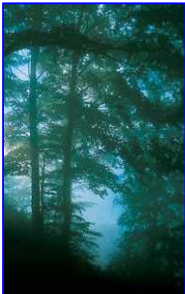
Aizarnatik Santa Engraziko ermitara doan igoerako pagadia.

Aizarnako harana Ernioko mazizoaren ipar-mendebaldeko muga dago. Arro itxiko harana da, Santa Engrazi, San Pelayo, San Juan eta Humilladero del Calcario ermitak babesten dituzten gainen artean gordetzen dituelarik bere lurrak. Aizarnako lurretara iristen diren urak leizeetan barneratzen dira, Aranburuko-zuloan adibidez, eta lurraren erraietan barrena doaz, bere iturbegiak Urolaren arroan sortzen direlarik.