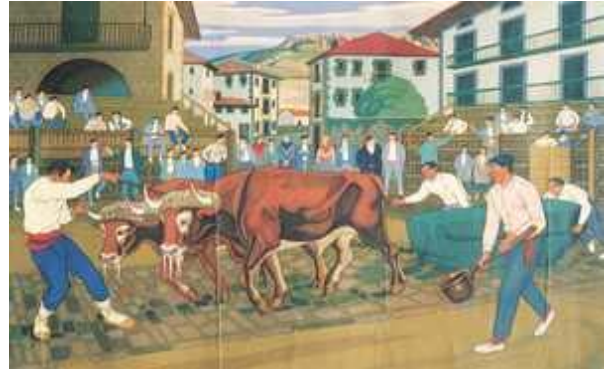
Idi-dema, José Arrueren litografía.

Ermitaren kanpoaldetik, aurreko eraikuntza baten arrastoak ikus daitezke eta baliteke antzinako tenplua (edo lehen babes-eliza, hurbileko Aiako Elkanoren antzekoa) egungoa baino txikiagoa izatea. Badago datu bat, santutegi hau joan den mendearen amaieran (1896an) berritu zela dioena. Gure garaian, auzolanean, berriro eraberritu zen. Obra hauek ez gaituzte harritu behar, tenplua eraiki zeneko lekua oso babesgabea baita.