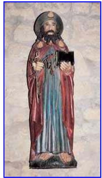
Santiago erromesaren irudia.