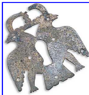
Elizako ate nagusiko burdineria.

irekita dagoena. Zuhaitz gutxi batzuek eta pilotalekuak osatzen dute geratzen zaigun lekurik ikusgarrienetariko bat. Plazatxoaren gainetik, karezko arkaitz baten gainaldean, Santa Engraziko ermita agertzen da.